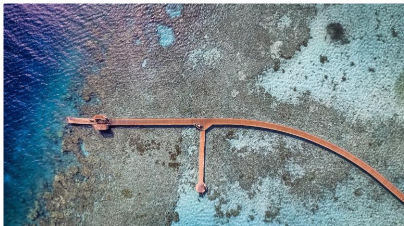
Der längste Steg von Ägypten