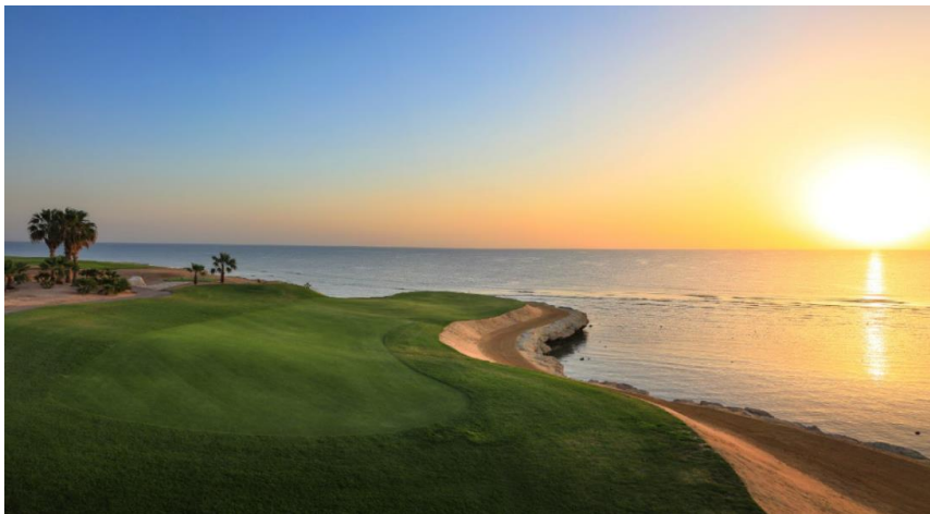
The Cascades Gary Player Championship Golfplatz

Das Bonussystem ermöglicht jedem Golfer durch die sozialen Komponenten des Golfsports über die ganze Saison hinweg Bonuspunkte zu sammeln und gegen hochwertige Preise einzutauschen. Bonuspunkte gibt es beispielsweise für jede gespielte Golfrunde, für jeden neu gespielten Club, für jeden geworbenen Freund u.v.m.