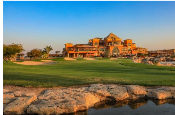
The Cascades Golf Resort, Spa & Thalasso

Das The Cascades Golf Resort, Spa & Thalasso Somabay wird zum STRAWBERRY TOUR-Kosmos, wenn die Tour Spieler Einzug halten. In dem schicken Luxus-Hotel im Herzen des 18-Loch Golfplatzes ist man immer schnellstens am Ball mit dem Platz vor der Haustür. Highlights des glanzvollen Resorts mit 166 komfortablen Zimmern & Suiten ist die Terrasse mit Panoramablick auf Golfplatz, Wüste und Meer für Frühstück und Abendessen, die exklusive Variation an kulinarischen Genüssen für jeden Food-Trend und das angeschlossene Thalasso-Spa, das regelmäßig als bester Wellnesstempel Ägyptens Furore macht.