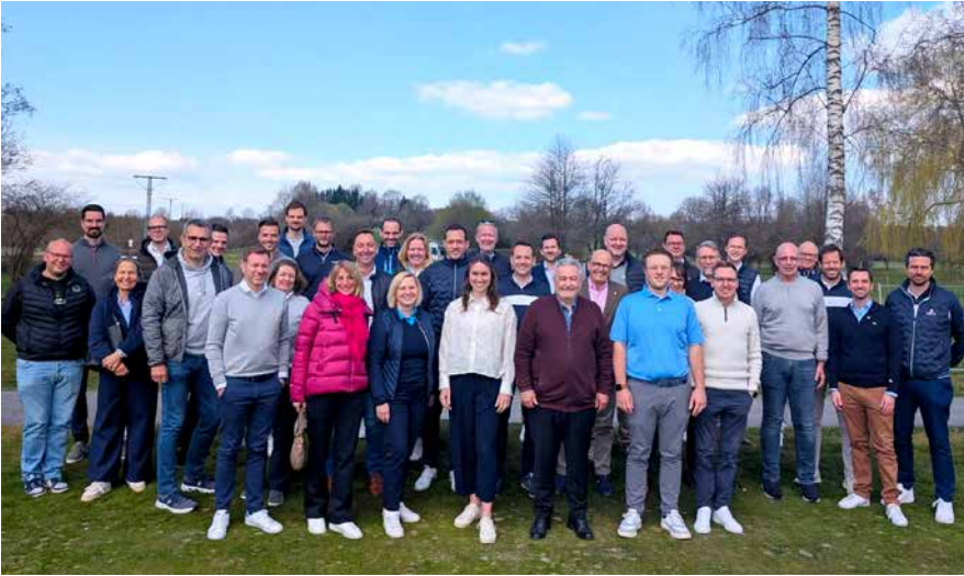
Top-Beteiligung beim Frühjahrsseminar des RK MITTE im GC Westerwald