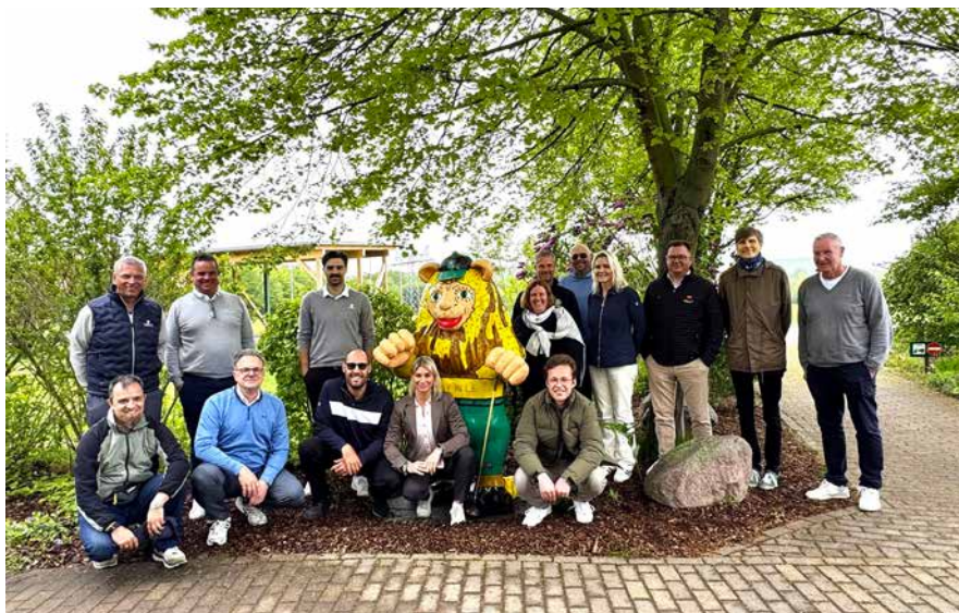
Der RK OST traf sich im GolfPark Leipzig

Die Frühjahrsseminare 2026 überzeugten erneut durch hochkarätige Referentinnen und Referenten aus unterschiedlichsten Bereichen. Vertreter aus Profisport, Medien, Kommunikation, Greenkeeping, Verbandsarbeit und Technologie lieferten praxisnahe Einblicke und konkrete Lösungsansätze für den Cluballtag.