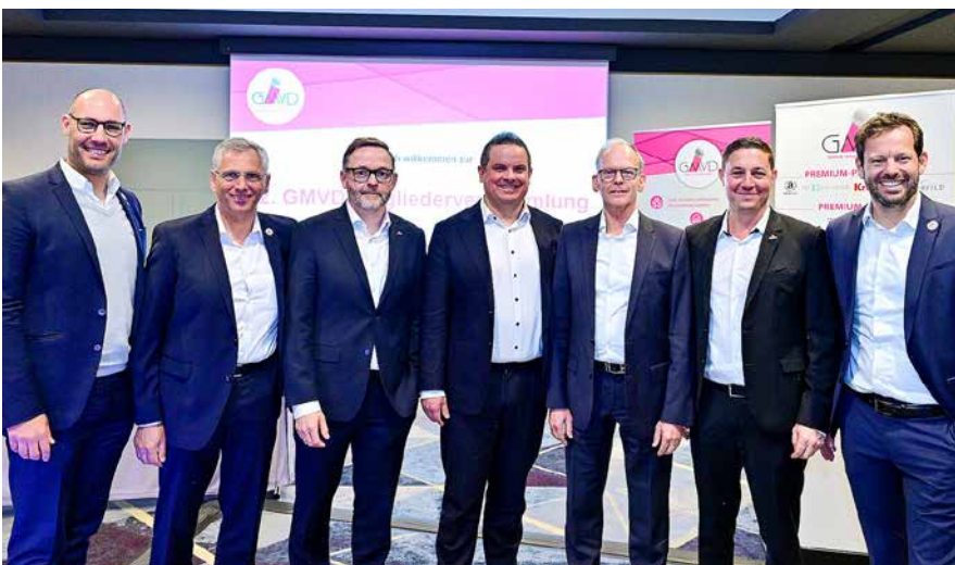
Der amtierende GMVD-Vorstand mit altem und neuem Geschäftsführer.

Der GMVD wurde am 19. Oktober 1994 in Bonn gegründet, hat seinen Sitz seit 2007 in München und ist neben der PGA of Germany, dem Bundesverband Golfanlagen (BVGA) und dem Greenkeeper Verband Deutschland (GVD) einer der großen Berufsfachverbände.