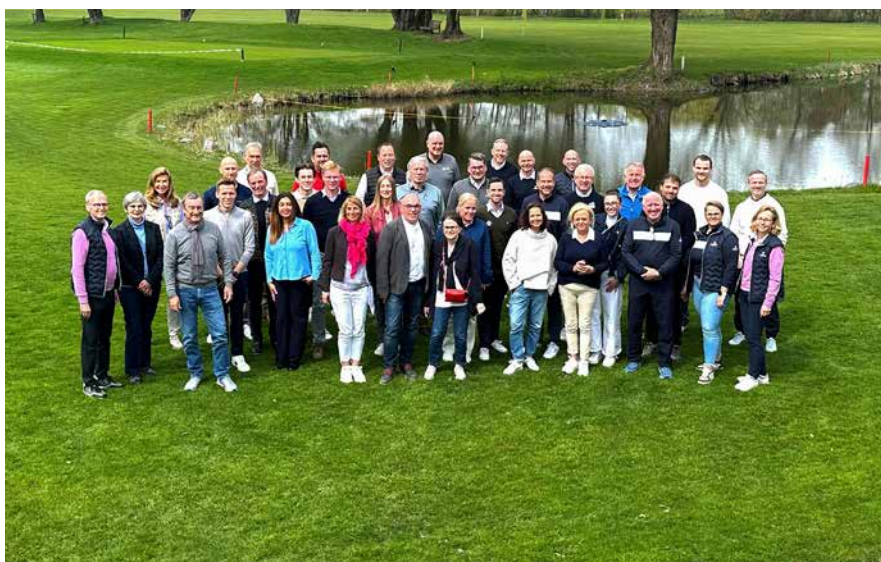
Großartige Teilnehmerzahl im GC Ingolstadt beim RK SÜDOST (Bayern, Österreich)