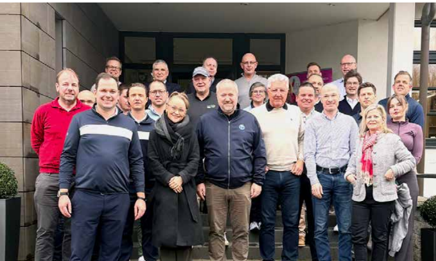
Gut besuchtes Frühjahrsseminar des RK WEST (NRW) im GC Haan-Düsseltal

Zu den besonderen Höhepunkten zählen unter anderem: