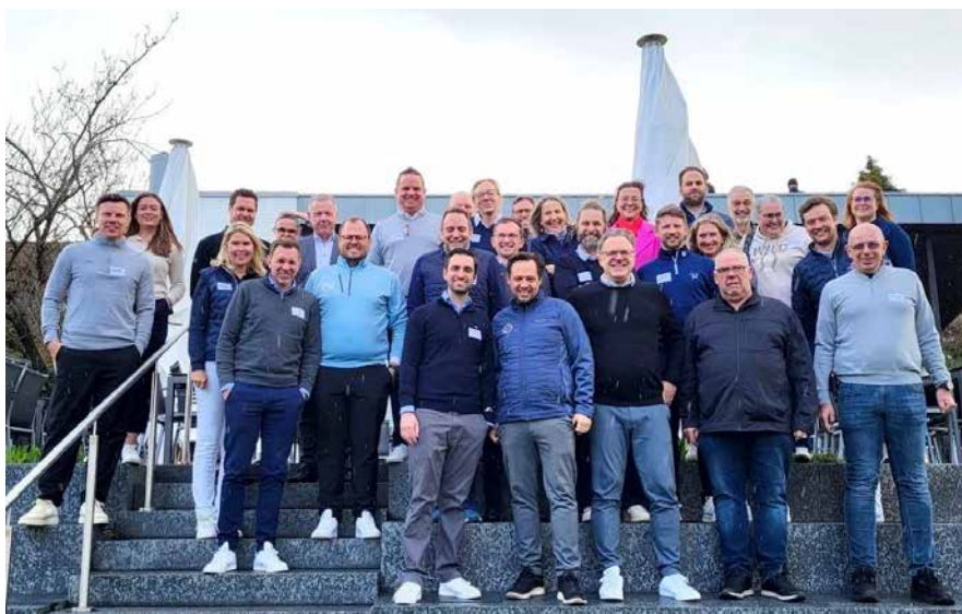
Sehr gute Beteiligung beim RK NORD im GC Hamburg-Ahrensburg