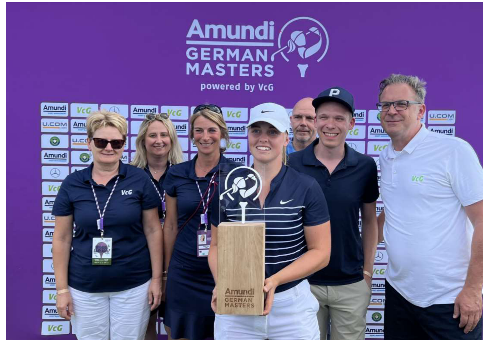
Das VcG-Team mit Maja Stark – Siegerin der Amundi German Masters powered by VcG 2022

Im Rahmen des Förderprojekts „pay & play“ hat die VcG so bspw. den Bau von 27 öffentlichen Kurzplätzen unterstützt. Die bundesweite Schulsport-Initiative „Abschlag Schule“ hat dank VcG-Fördermittel über 200.000 Schülerinnen und Schülern Golfunterricht ermöglicht. Kampagnen zur Image- und Wachstumsförderung wie z. B. „play golf – start living“, „Golf. Mitten ins Glück“ oder „Gemeinsam golfen“ konnten nicht zuletzt dank der großzügigen finanziellen Unterstützung der VcG umgesetzt werden. Seit zwei Jahren stärkt sie als Partner von Special Olympics Deutschland auch inklusive Projekte im Golfsport. Und mit ihrem Engagement als Powering Partner der Amundi German Masters und der Big Green Egg German Challenge finden nach mehrjähriger Pause wieder zwei bedeutende Profiturniere in Deutschland statt.